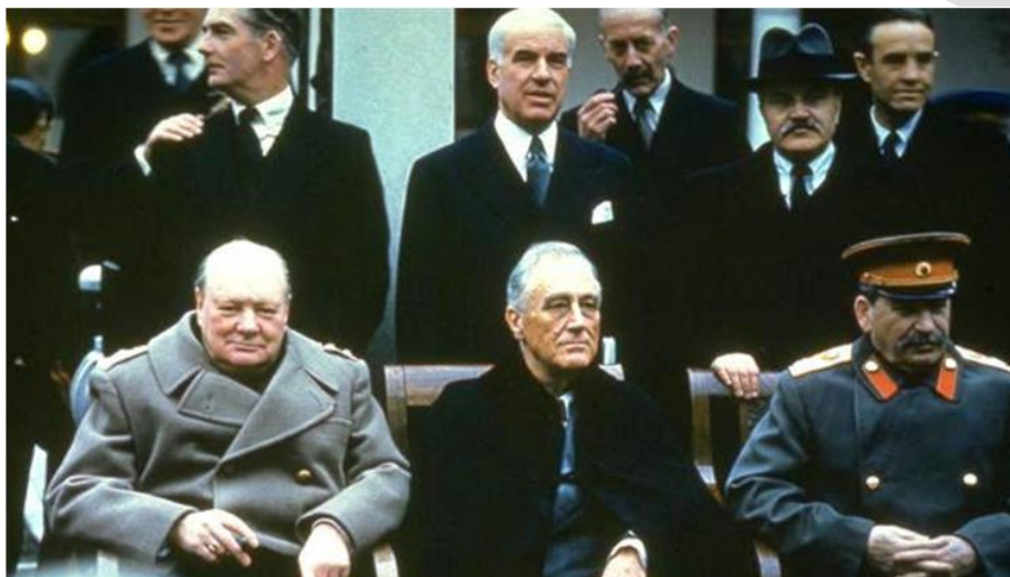
Hình 1: Thủ tướng Anh- U. Sôcxin, Tổng thống Mĩ- Ph. Ru dơ ven, Chủ tịch Hội đồng Bộ trưởng Liên Xô- I. Xtalin (từ trái qua phải) tại Hội nghị Ianta

⇒ Một hội nghị quốc tế đã được triệu tập tại Ianta (Liên Xô) từ ngày 4 đến ngày 11- 2- 1945, với sự tham dự của nguyên thủ ba cường quốc là I. Xtalin (Liên Xô), Ph. Rudove (Mĩ) và U. Sôcxin (Anh).