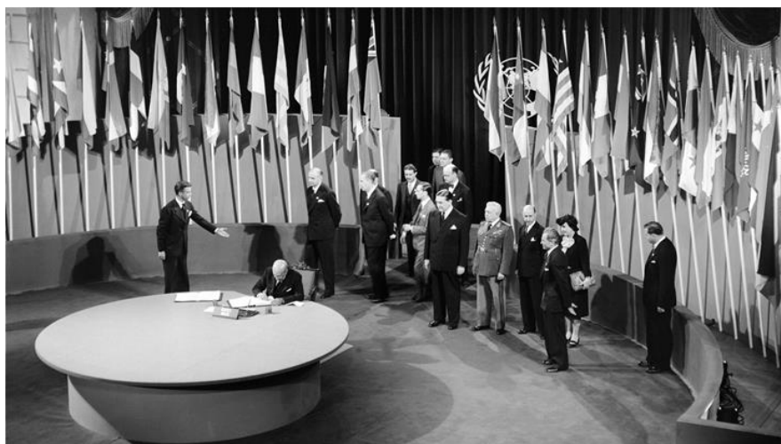
Hình 3: Lễ kí Hiến chương Liên hợp quốc tại Xan Phranxico (Mĩ)