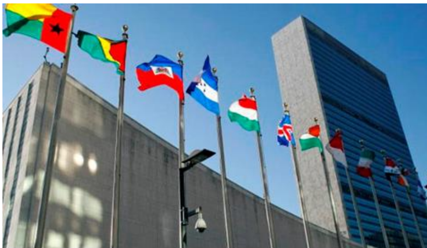
Hình 4: Trụ sở chính của Liên hợp quốc tại Niu Ooc