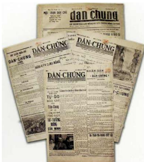
Hình 2: Báo Dân chúng ra đời trong Phong trào dân chủ 1936 - 1939