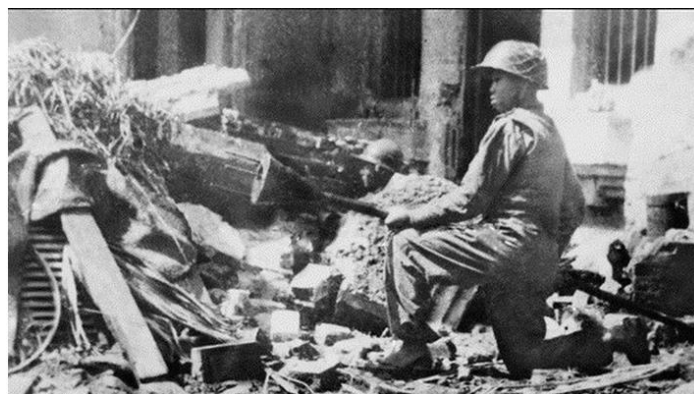
Hình 3: “Quyết tử quân” Hà Nội ôm bom ba càng đón đánh xe tăng Pháp