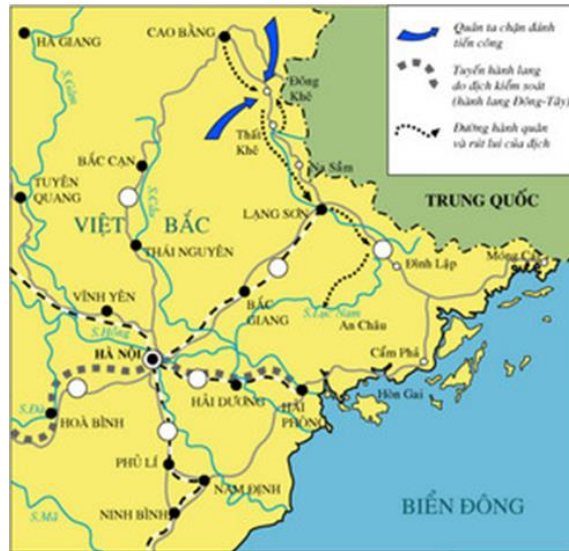
Hình 5: Lược đồ chiến dịch Biên giới