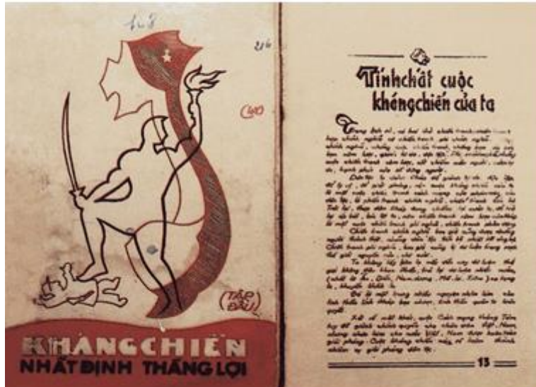
Hình 2: Tác phẩm Kháng chiến nhất định thắng lợi