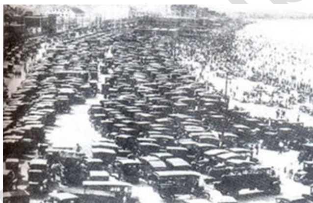
Hình 1: Bãi đỗ ô tô ở Niu-ooc năm 1928