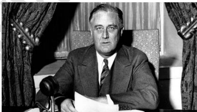
Hình 2: Tổng thống Ru-đơ-ven công bố Chính sách mới qua đài phát thanh

- Cuối năm 1932 Ru-đơ-ven đã thực hiện một hệ thống các chính sách biện pháp của nhà nước trên các lĩnh vực kinh tế - tài chính và chính trị - xã hội được gọi chung là Chính sách mới.