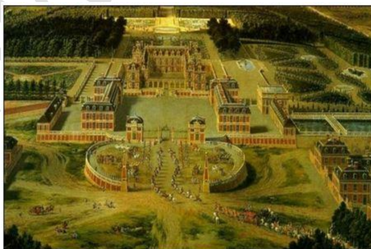
Hình 4: Cung điện Véc-xai

+ Kiến trúc: Cung điện Véc xai được hoàn thành vào năm 1708; Bảo tàng Anh; Viện bảo tàng Ec-mi-ta-giơ; Bảo tàng Lu-vơ (Pa-ri-Pháp), là bảo tàng bằng hiện vật lớn nhất thế giới.