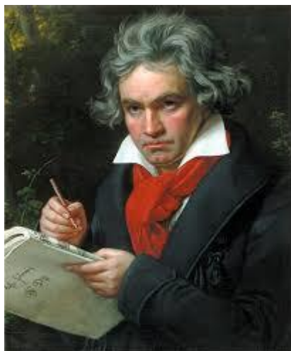
Hình 2: Bét- tô- ven (1770- 1827)