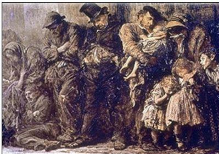
Hình 3: Những người khốn khổ của Vích to Huy go