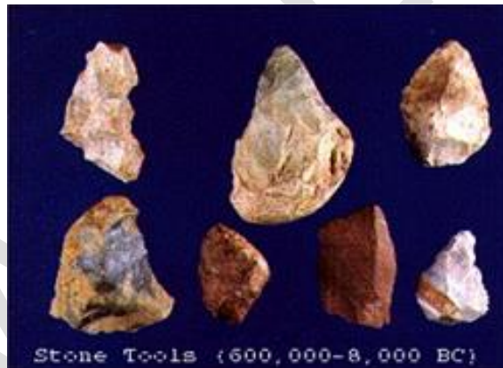
Hình 1: Đồ đá cũ