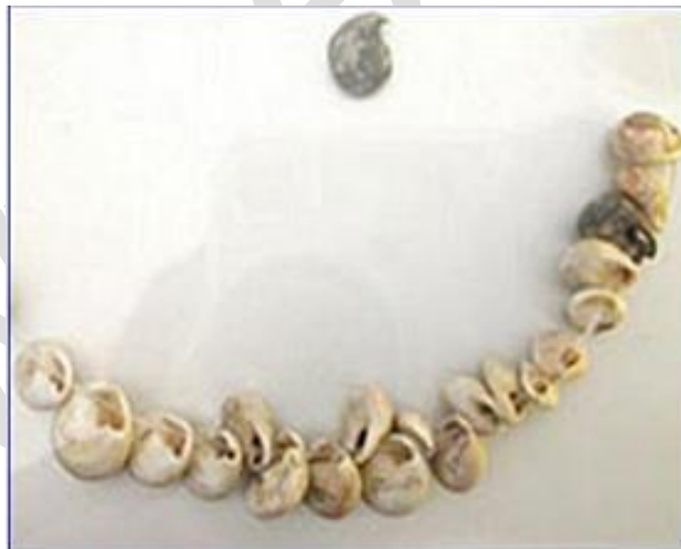
Hình 6: Đồ trang sức được làm từ vỏ ốc