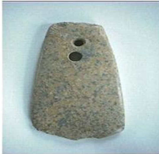
Hình 5: Đồ đá mới