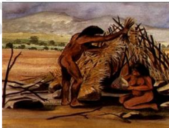
Hình 4: Cư trú “nhà cửa”