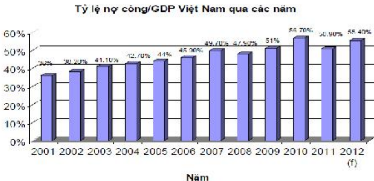
Hình 1: Tỷ lệ nợ công/GDP từ năm 2001 đến năm 2012

Theo công bố của Tạp chí Kinh tế (The Economist), tỷ lệ nợ công năm 2011 của Việt Nam là 50,9% GDP, dự kiến năm 2012 tỷ lệ này là 55,4%. Mặc dù tỷ lệ nợ này vẫn nằm trong tầm kiểm soát (dưới 60% GDP theo cách tính chỉ tiêu tỷ lệ nợ công trên GDP của Liên hiệp quốc) nhưng nó quá cao so với mức phổ biến được khuyến cáo ở các nền kinh tế đang phát triển (từ 30-40%) và so với một số nền kinh tế mới nổi như Trung Quốc (17,4%), Indonesia (25,6%).